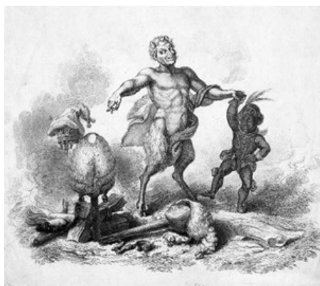
Fig. 1 – Frontispiece illustration to vol. i of the Black Dwarf , 1818

I am not, I find, to go to court at St. James’s; but to one opened periodically at Warwick. They consult my preference of the country in this warm season, and indulge me with a journey to that ancient and respectable town, where I shall no doubt be taken proper care of, and every attention will be paid to my comfort, and consolation ( LBD , August 11, 1819, vol. iii: 524-5).